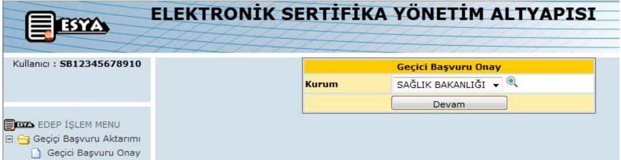
Şekil 4 – Kayıtçı Geçici Başvuru Onay – Ana Kurum Seçimi

Geçici Başvuru Onay (Şekil 4) penceresindeki kurum bilgisi varsayılan olarak "SAĞLIK BAKANLIĞI" gelmektedir, Devam butonuna basılır.