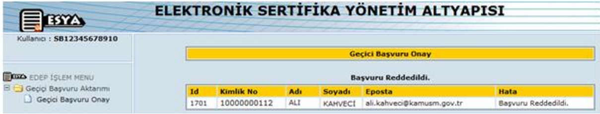
Şekil 8 – İptal Edilmiş Başvuru

Kurum Yetkilisi tarafından başvurusu iptal edilen ( Şekil 8 ) kullanıcıya iptal E-Postası ( Şekil 9 ) gider.