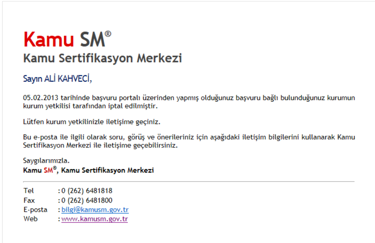
Şekil 9 – Başvurusu İptal Edilmiş Kullanıcıya Gönderilmiş E-Posta

Kullanıcı bir kez başvuru yapıp Kurum Yetkilisi tarafından onaylandıktan sonra Kurumsal Müşteri Temsilcisi de kullanıcının başvurusunu onaylayınca, kullanıcı sertifikası üretilene kadar yeni başvuru yapamaz, eğer Kurum Yetkilisi kullanıcının başvurusunu iptal ederse kullanıcı yeni başvuru yapabilir.