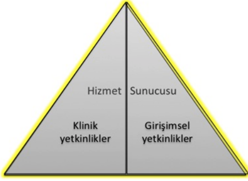
Şekil 2- TUKMOS yedinci temel yetkinlik alanı: Hizmet Sunucusu

Girişimsel Yetkinlik: Bilgiyi, kişisel, sosyal ve/veya metodolojik becerileri tıbbi girişimler konusunda kullanabilme yeteneğidir.